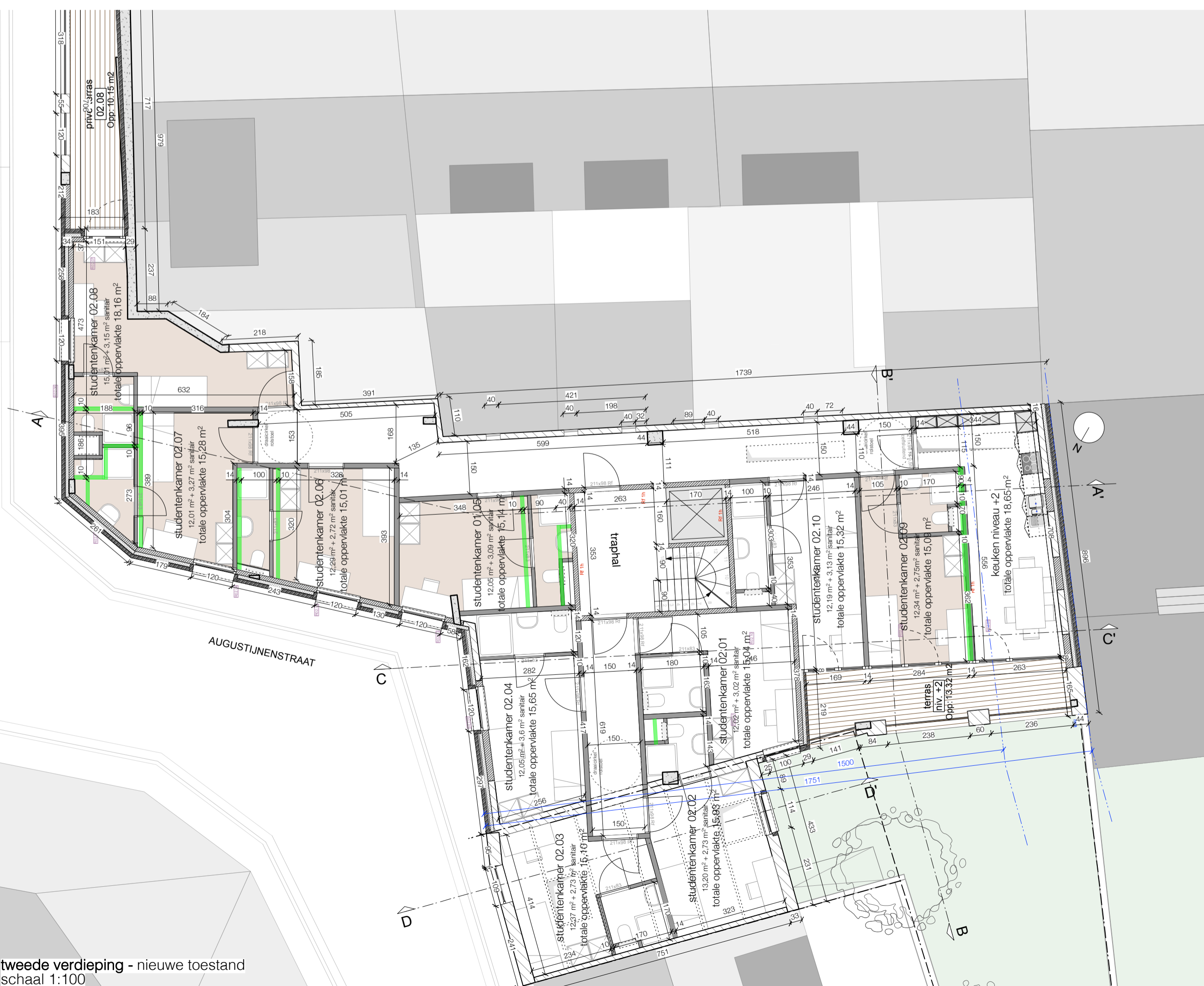
tweede verdieping - nieuwe toestand schaal 1:100