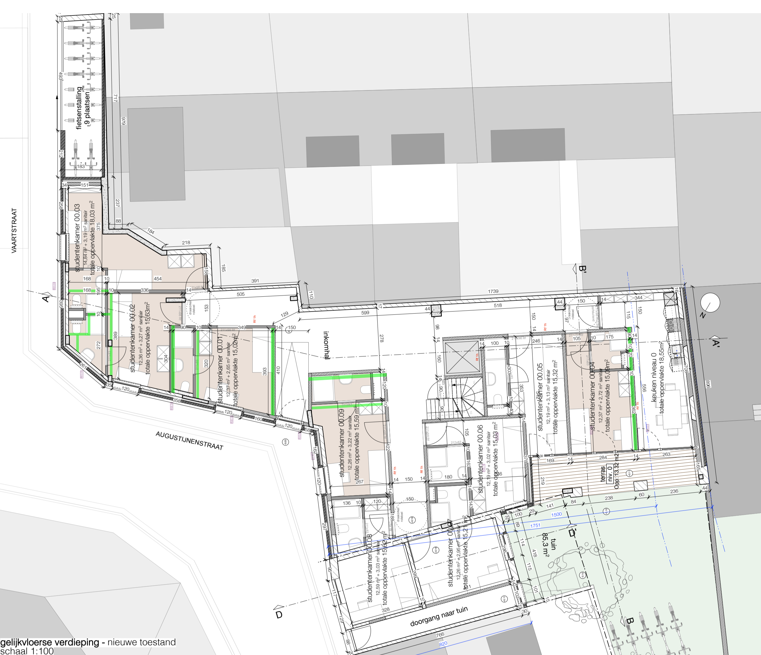
gelijkvloerse verdieping - nieuwe toestand schaal 1:100