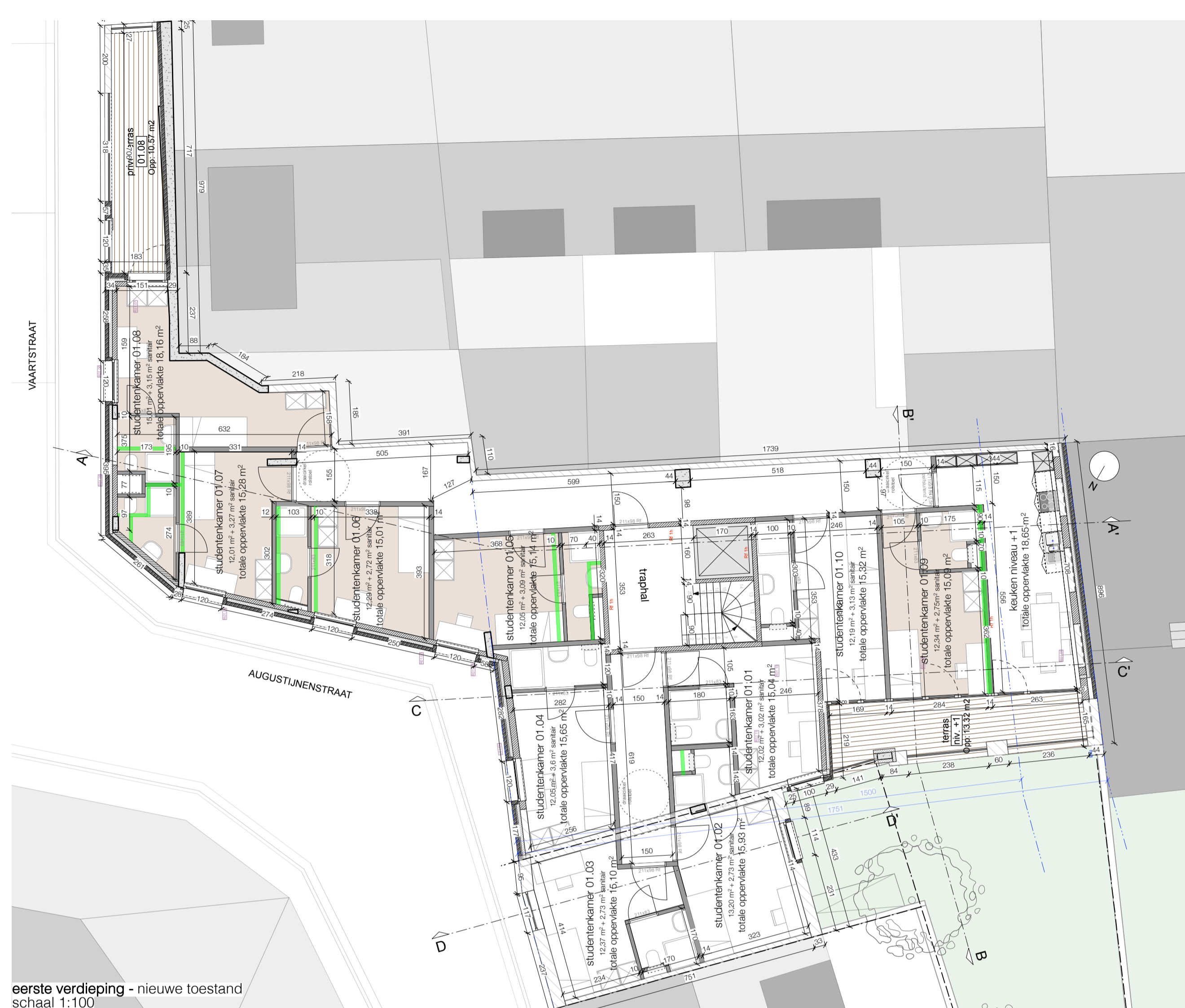
eerste verdieping - nieuwe toestand schaal 1:100